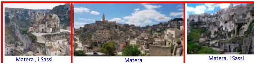
Matera , i Sassi

DA BARI A MATERA - Km. 66. Visita guidata dei Sassi. Pernottamento