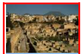
Ecolano, gli Scavi